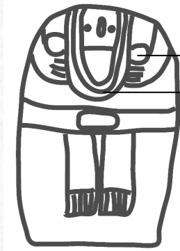
Statue Féminine ex : Granisse